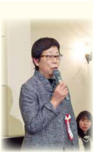
(S 64 年度 卒 T・U)

●話す機会があり（驚きましたが）人前でマ イクを持って話すことが、保育園で仕事し て以来でした。 まだまだ未熟ですが、御指導頂けたら有難 いです。