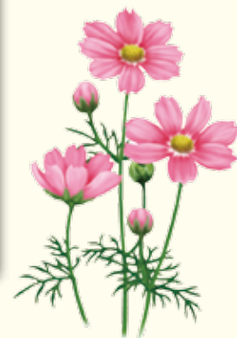
秋草学園短期大学秋桜会同窓会